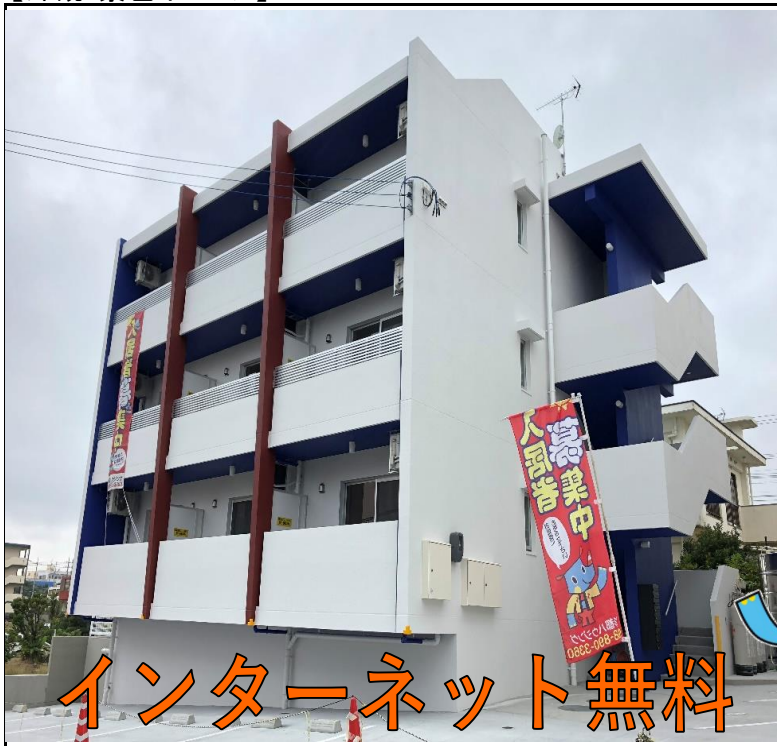
【外観・景色イメージ】